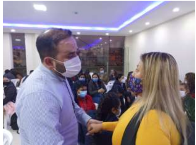
Sesión de Zoom